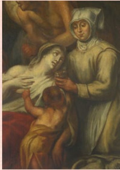
Jacob JORDAENS (1593-1678), De Gasthuizusters van Antwerpen (detail)

Het Musée Hôpital Notre-dame à la Rose won in 2010 de Museumprijs voor Wallonië. Het dankt deze prijs onder andere aan de zeer uitgebreide collectie die een unieke blik in de geschiedenis van een vergeten vrouwencultuur biedt. Het Maagdenhuismuseum geeft het Waalse museum graag de ruimte om een selectie van zijn rijke erfgoed tentoon te stellen.