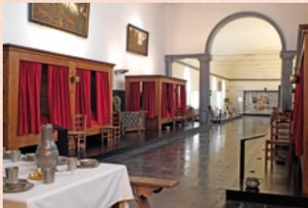
Zicht op de eerste ziekenzaal (circa 1715) van het Hôpital Notre-Dame à la Rose (Lessines)

De collectie die we tentoonstellen zoomt in op het leven en werk van de gasthuizusters. Hadden zij een roeping of zagen zij intreden in een klooster als een kans om zich te ontwikkelen? Hoe zat het met de tucht en discipline in de orde? Hoe beoefenden zij geneeskunde?