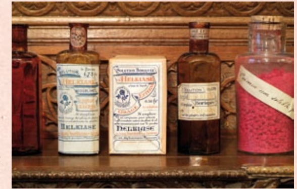
Flesjes 'Heliasie', een geneesmiddel ontwikkeld door de gasthuizusters van het Hôpital Notre-Dame à la Rose (19de eeuw).